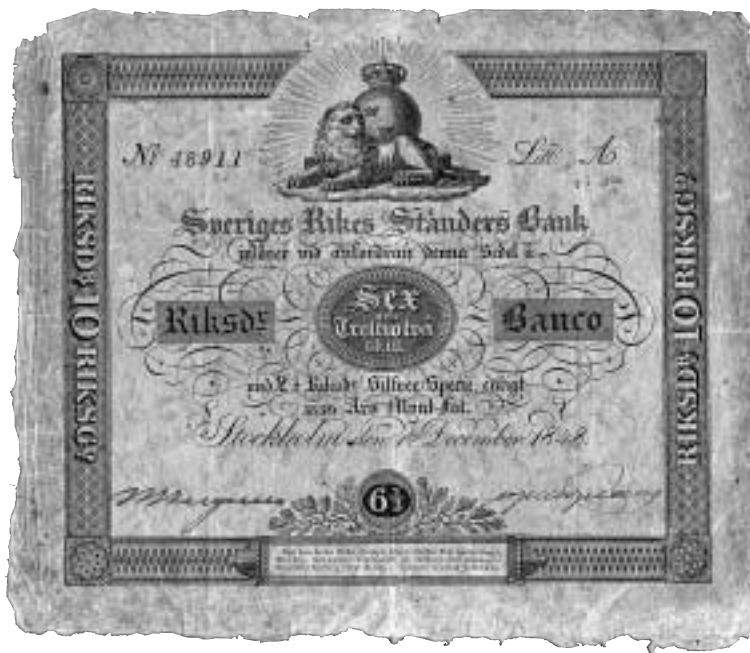
Grön sedel om 6 2/3 riksdaler banko 1848. På sedeln anges 6 riksdaler 32 skilling banko, vilket motsvarade 10 riksdaler riksgälds. Förminskad.

Vad gör just Munterhetens droppar så intressant för SNT:s läsekrets? Jo, på sidorna 89-90 som anekdot nummer 156 fångades jag av rubriken ”En gammal sedel”, vilken förstas väckte min nyfikenhet. Som vi vet finner man ofta på den tomma baksidan av äldre svenska sedlar ett litet handskrivet poem. Ofta går texten ut på att ägaren hoppas att snart få sedeln tillbaka. Om sådana har då och då skrivits här i vår tidskrift och and-