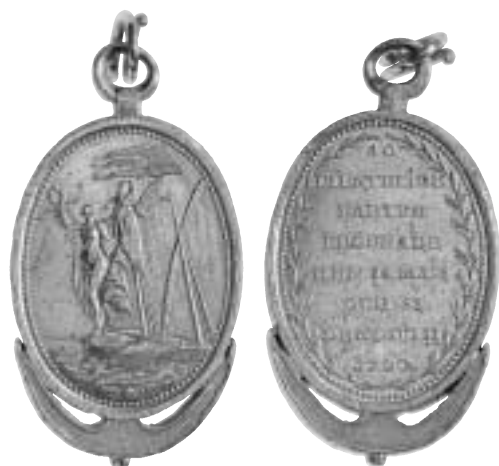
Fig. 5. Belöningsmedalj för båda slagen. Gravör: C. G. Fehrman.