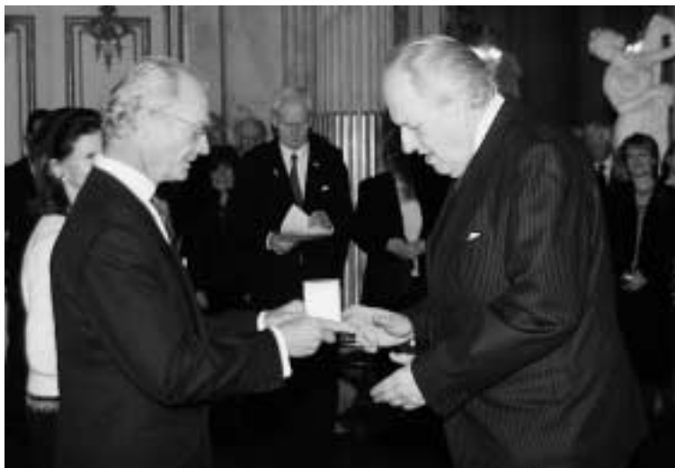
Den belönade tar emot medaljen av kungen och berättar en anekdot.