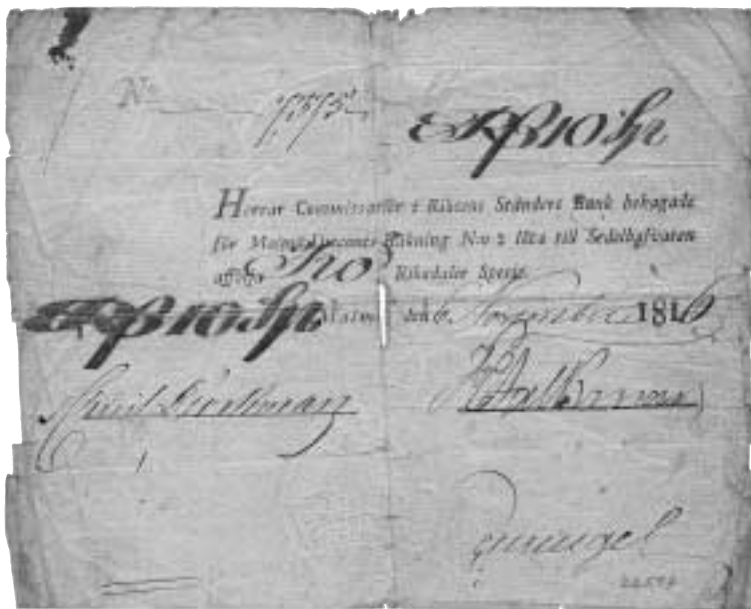
Assignment på 10 riksdaler specie, utgiven av Malmödiskonten 1816. Förminskad.

Klostergatan 5, 222 22 LUND Tel och fax 046-14 43 69 e-post: siv-gunnar@swipnet.se