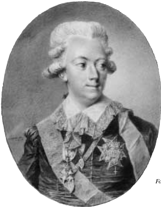
Fig. 11. Gustav III med Svensksundsmedaljen. Miniaturporträtt av Niclas Lafrensen d.y. Privat ägo.

”Nerike” från Finland, senare överstelöjtnant. Löfström s. 94. Fig. 9.