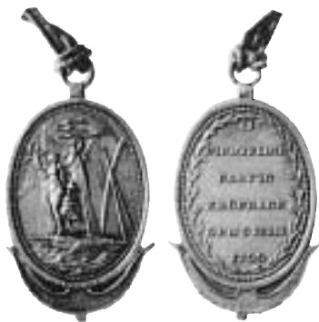
10. Tennexemplar (4L) i privat ägo, försedd med silvertråd.

B. Silverexemplar. Myntkabinettet, Finlands Nationalmuseum.