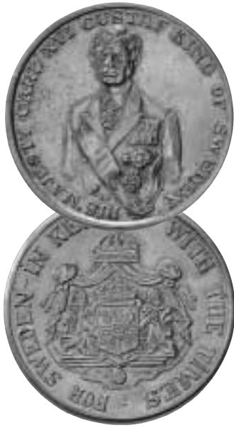
Carl XVI Gustaf på medalj. Vem som utfört medaljen är inte känt, men signaturen med bokstäverna E Γ (grekiska? E C?) kanske kan identifiera konstnären.