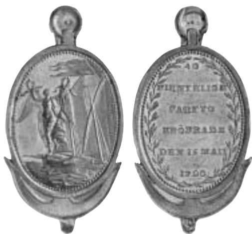
Fig. 3. Belöningsmedalj för dem som utmärkt sig i slaget vid Fredrikshamn. Gravör: C. G. Fehrman.