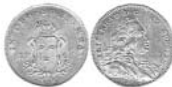
Fredrik I Dukat 1746 Ett objekt i maj auktionen

Välkommen som köpare eller inlämnare på våra auktioner.