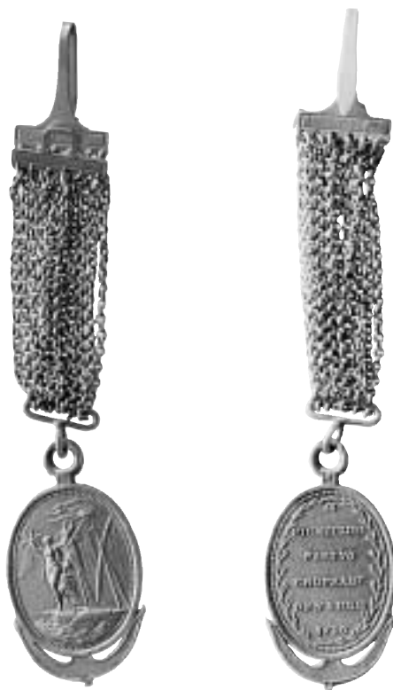
9. Guldexemplar av den mindre Svensundsmedaljen med senare tillverkad bäranordning i guld. Livrustkammaren. Nr 6 C nedan.

C. Silverexemplar, ej konturutsuret. 24,87 g. KMK. Sannolikt leveransexemplar från Kongl. Myntet.