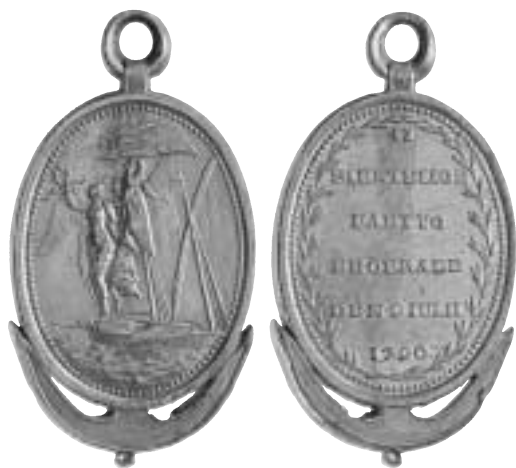
Fig. 4. Belöningsmedalj för dem som utmärkt sig i slaget vid Svensksund. Gravör: C. G. Fehrman.